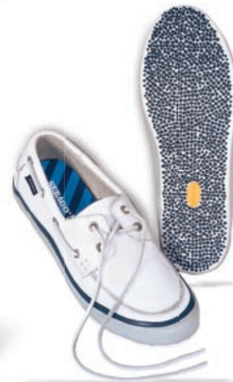
Mariner Soepele watersportschoen voor heren. Anti-slip Vibram® zool, zonder sporen Van maat 7 tot 13