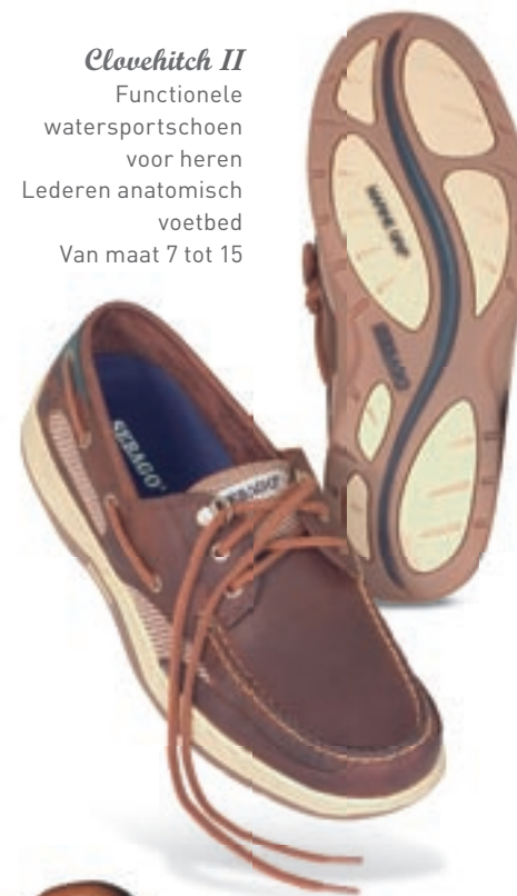
Clovehitch II Functionele watersportschoen voor heren Lederen anatomisch voetbed Van maat 7 tot 15

Ferrari Driving mocs in leder voor heren Met handgenaaid plateau Rubberen zool Van maat 7 tot 13